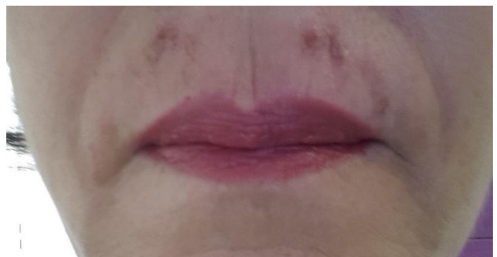
8. Tag nach der Behandlung ohne Makeup