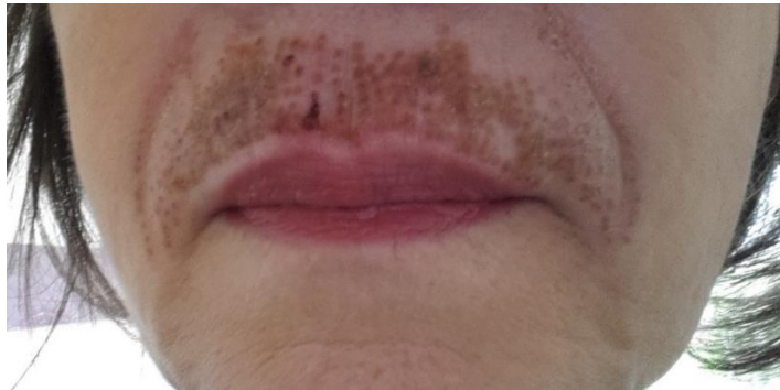
2. Tag nach der Behandlung