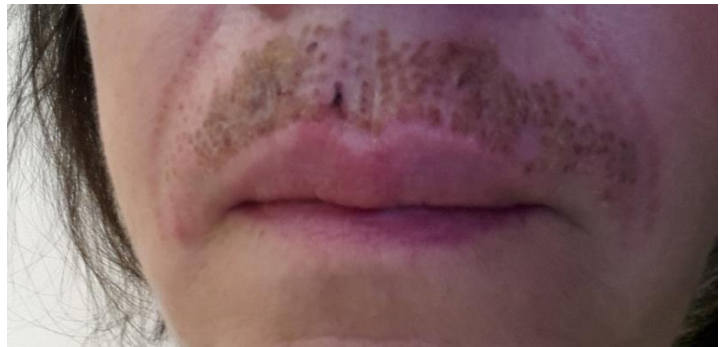
4. Tag nach der Behandlung