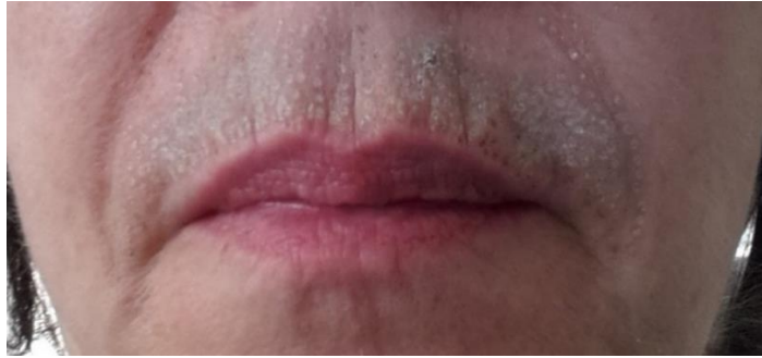
direkt nach der Behandlung