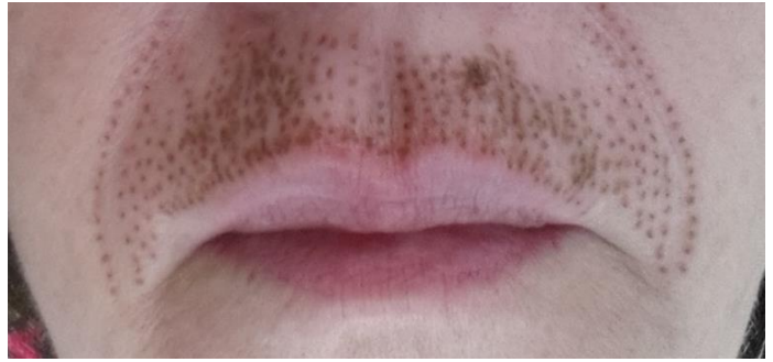
1. Tag nach der Behandlung