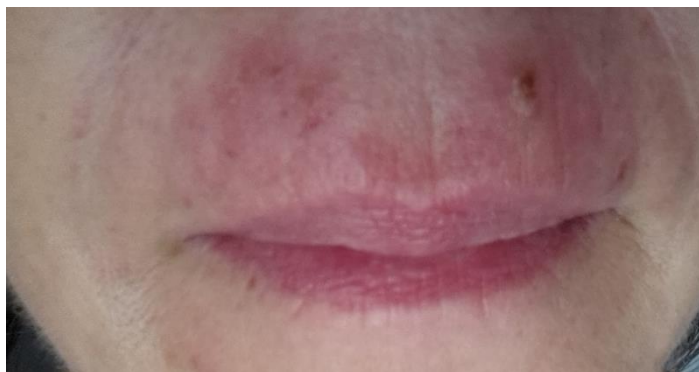
7. Tag nach der Behandlung