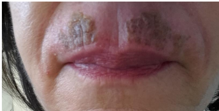
5. Tag nach der Behandlung